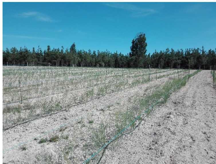
1 DE AGOSTO DE 2018 APÓS PLANTAÇÃO TAMBÉM NO MESMO ANO