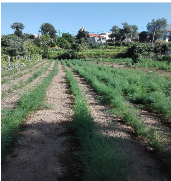
15 DE SETEMBRO 2018, APÓS PLANTAÇÃO EM MAIO DO MESMO ANO

EM TERMOS DE DENSIDADES COSTUMAMOS USAR EM MÉDIA 27 A 30.000 PLANTAS POR HECTARE COM COMPASSOS APROXIMADOS DE 1,5 X 0,20 A 0,25